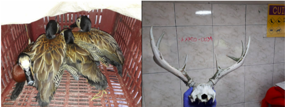
Foto 2 y 3. Valoración de cuatro (4) individuos de Dendrocygna viduata – Pato careto y un (1) espécimen no vivo (cuernos) de Odocoileus virginianus – Venado coliblanco. Incautados. Acta Única de Control al Tráfico Ilegal de Flora y Fauna Silvestre No. 160857.

En el momento de la valoración preliminar de los especímenes de Pato Careto, se encontró que los individuos eran adultos y que la cornamenta del Venado Coliblanco pertenecía a un individuo adulto (Foto 2 y 3).